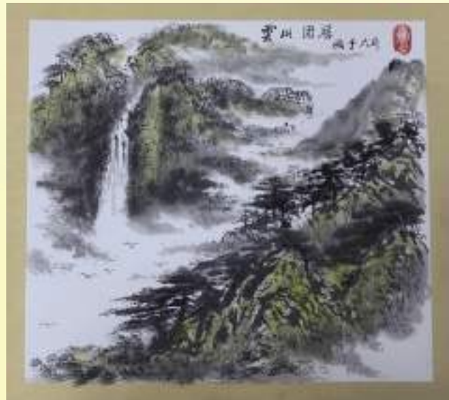
孔宪玉《云山固居》绘画类第三名